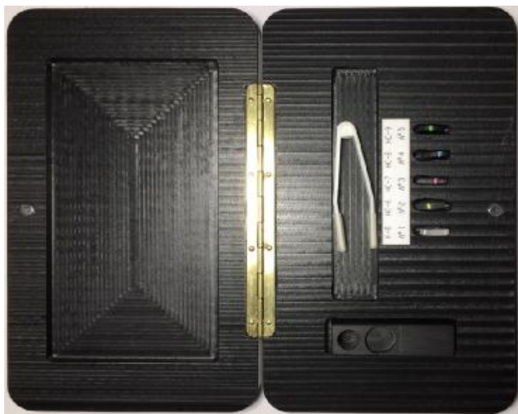
Рисунок 2 – Общий вид наборов стеклянных мер оптической плотности НОСМОП-9 в футляре