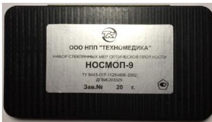
Рисунок 3 – Вид и обозначение маркировки