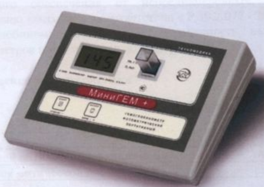
Рисунок 1 - Гемоглобинометр фотометрический портативный ГФП-01

Общий внешний вид гемоглобинометров показан на рисунке 1, схема маркировки и пломбировки - рисунок 2.